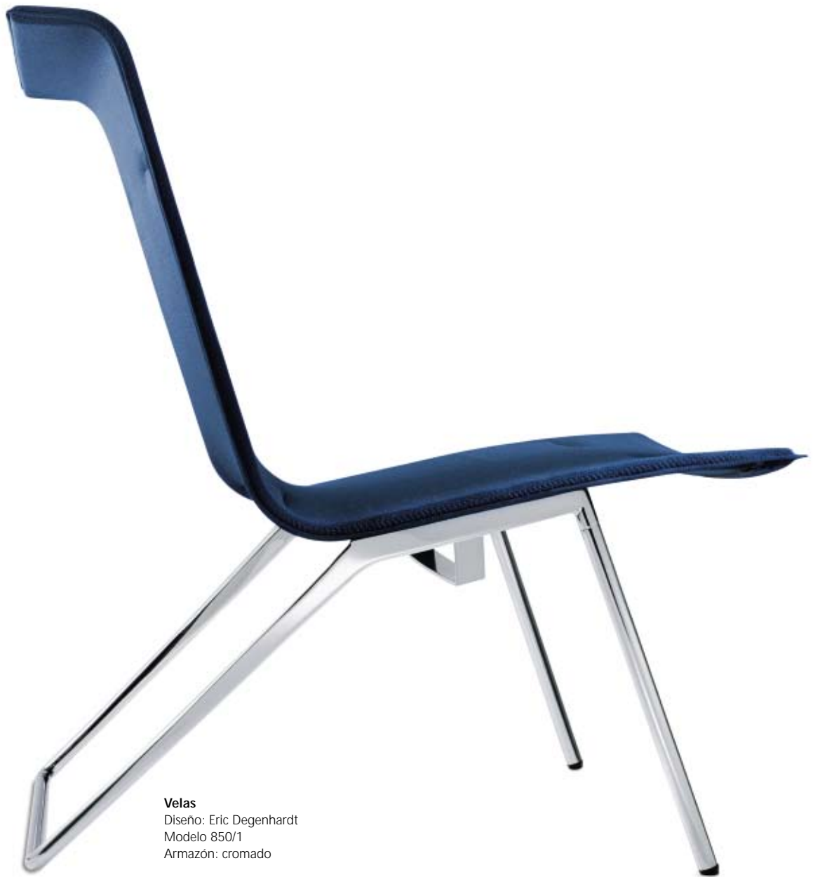
Velas Diseño: Eric Degenhardt Modelo 850/1 Armazón: cromado